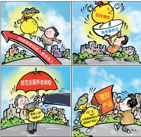
让百姓“钱袋子”鼓起来

习近平总书记指出,“中国将更加积极贯彻男女平等基本国家,发挥妇女‘半边天’作用,支持妇女建功立业,实现人生理想和梦想。”踏上新征程,砥砺再前进。我们相信,陕西省委党校(行政学院)女教职工一定会不负时代、不负韶华,积极投身建设一流省级党校(行政学院)的火热实践,必将续写无愧于历史、无愧于时代的巾帼华章!