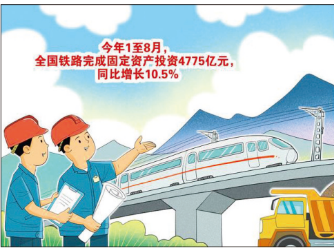
全国铁路建设 新华社发 朱慧卿 作