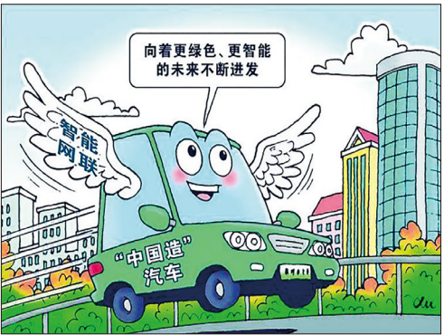
“驶”向未来 新华社发 徐敏 作