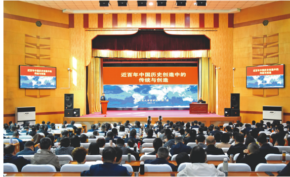
主体班次学员和部分教师代表听取讲座。

展蒸蒸日上、越来越好。 本次祝寿会不仅传递了校（院）对退休人员的深切关爱，更弘扬了中华民族孝亲敬老的传统美德，进一步营造了尊老、敬老、爱老、助老的和谐氛围。 会上，省民政厅向校（院）全体老同志赠送了《陕西省老年文化系列丛书》。范永斌对省民政厅长期以来对党校工作和老干部工作的支持表示感谢，他希望省民政厅今后能一如既往地关心帮助党校事业的发展。